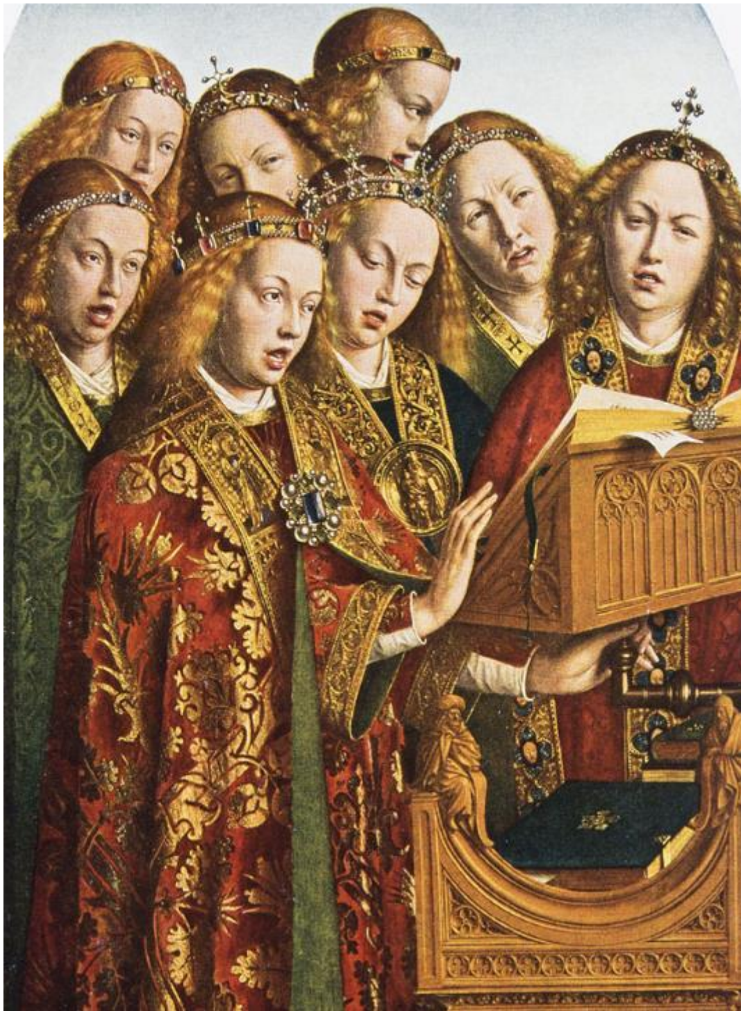
Anges chanteurs (détail de l'Agneau mystique), par Jan van Eyck, 1432, Cathédrale Saint-Bavond de Gand, Belgique

Le 10 mai 2020 – Cantate – La communauté chantante