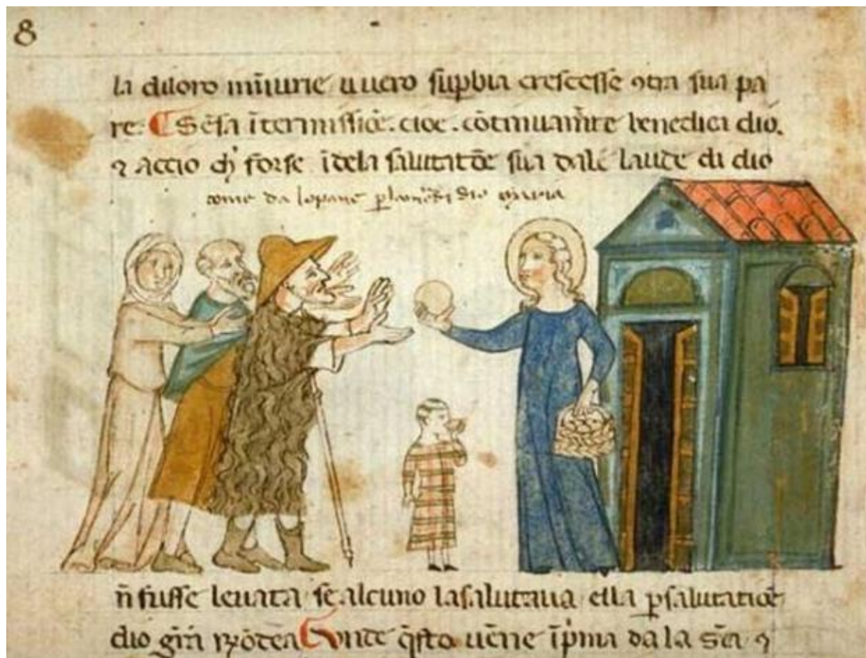
L'aumône aux pauvres, vers 1330-1340

Je crois que par l'amour, la vie touche à la vie éternelle, Et qu'en Dieu nous demeurons dans la liberté et dans la joie. Amen