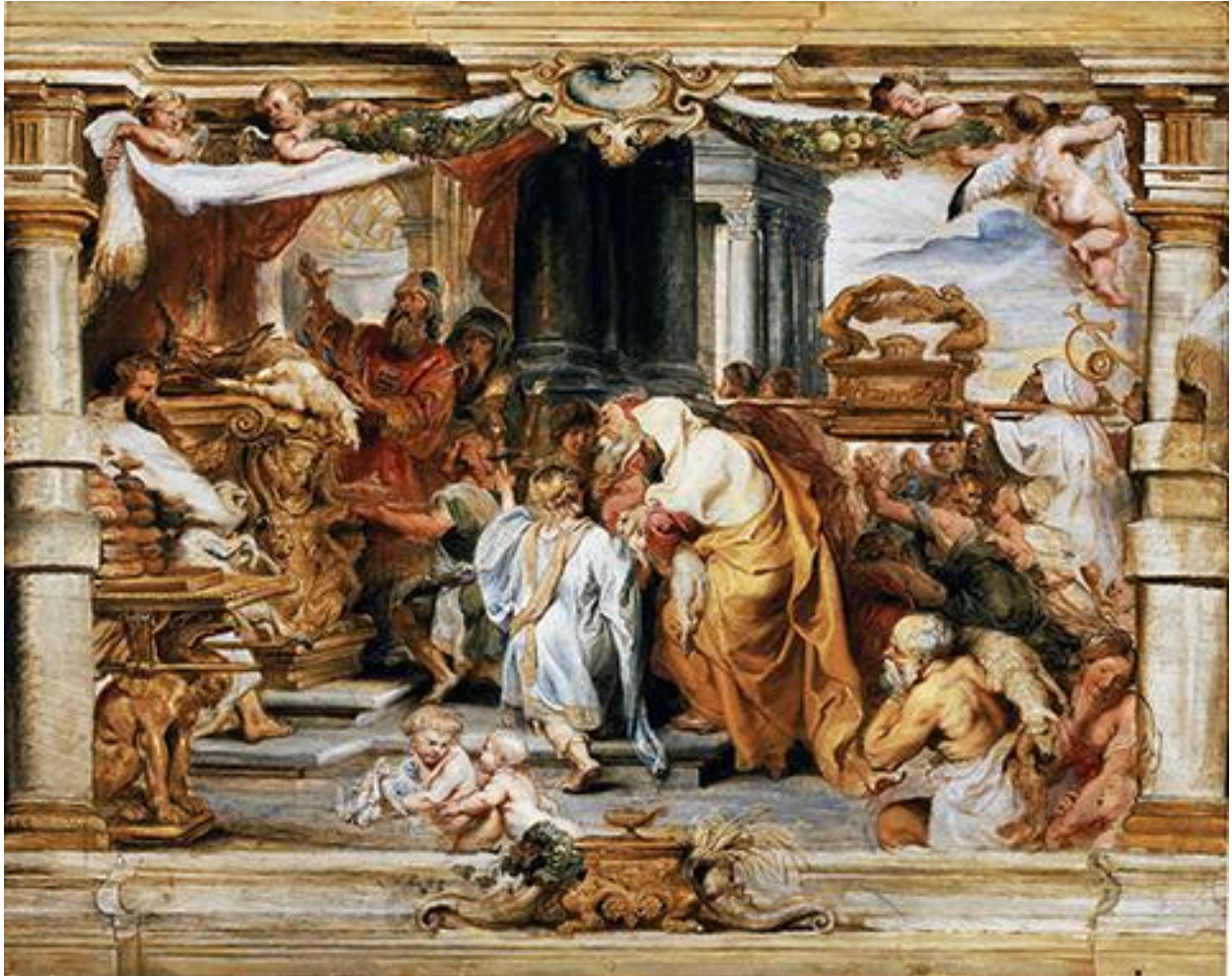
Paul Rubens, Le sacrifice de l'ancienne alliance, 1626, Museum of Fine Arts, Boston