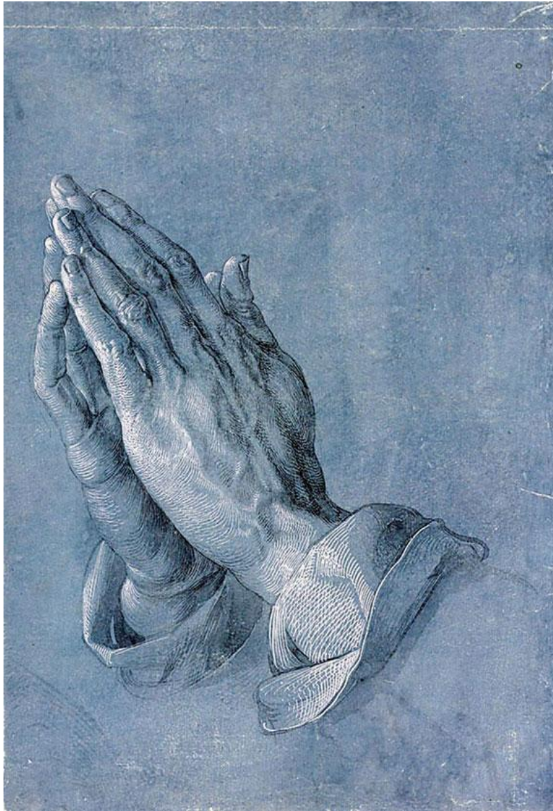
Albrecht Dürer, Mains en prière, 1508, Collections Albertina, Vienne