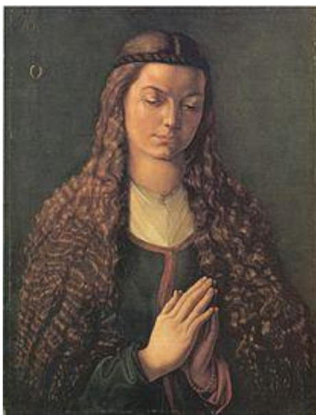
Albrecht Dürer, Jeune fille aux cheveux dénoués, 1497, Städel Museum

• Chant : Alléluia 41/01 – Louange et gloire aux plus hauts des cieux