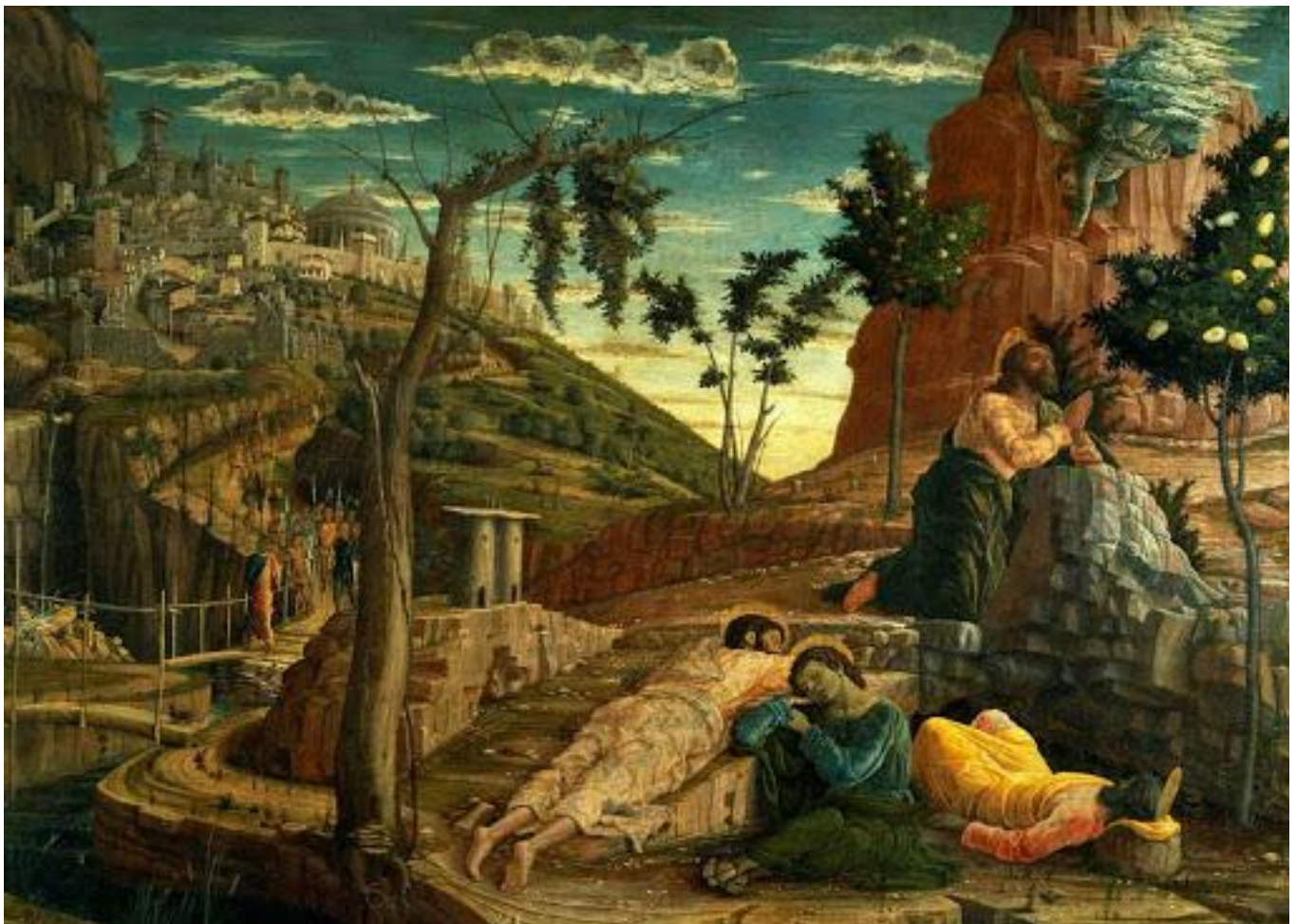
Mantegna, La prière au Jardin des oliviers, 1456, Musée des Beaux-Arts, Tours

Le 17 mai 2020 – Rogate – L'Église en prière