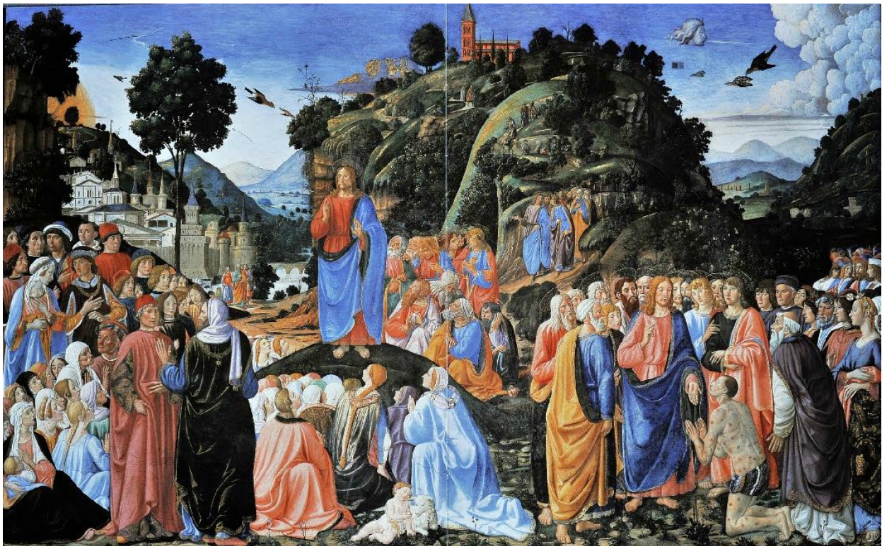
Cosimo Rosselli, Le Sermon sur la montagne, chapelle Sixtine