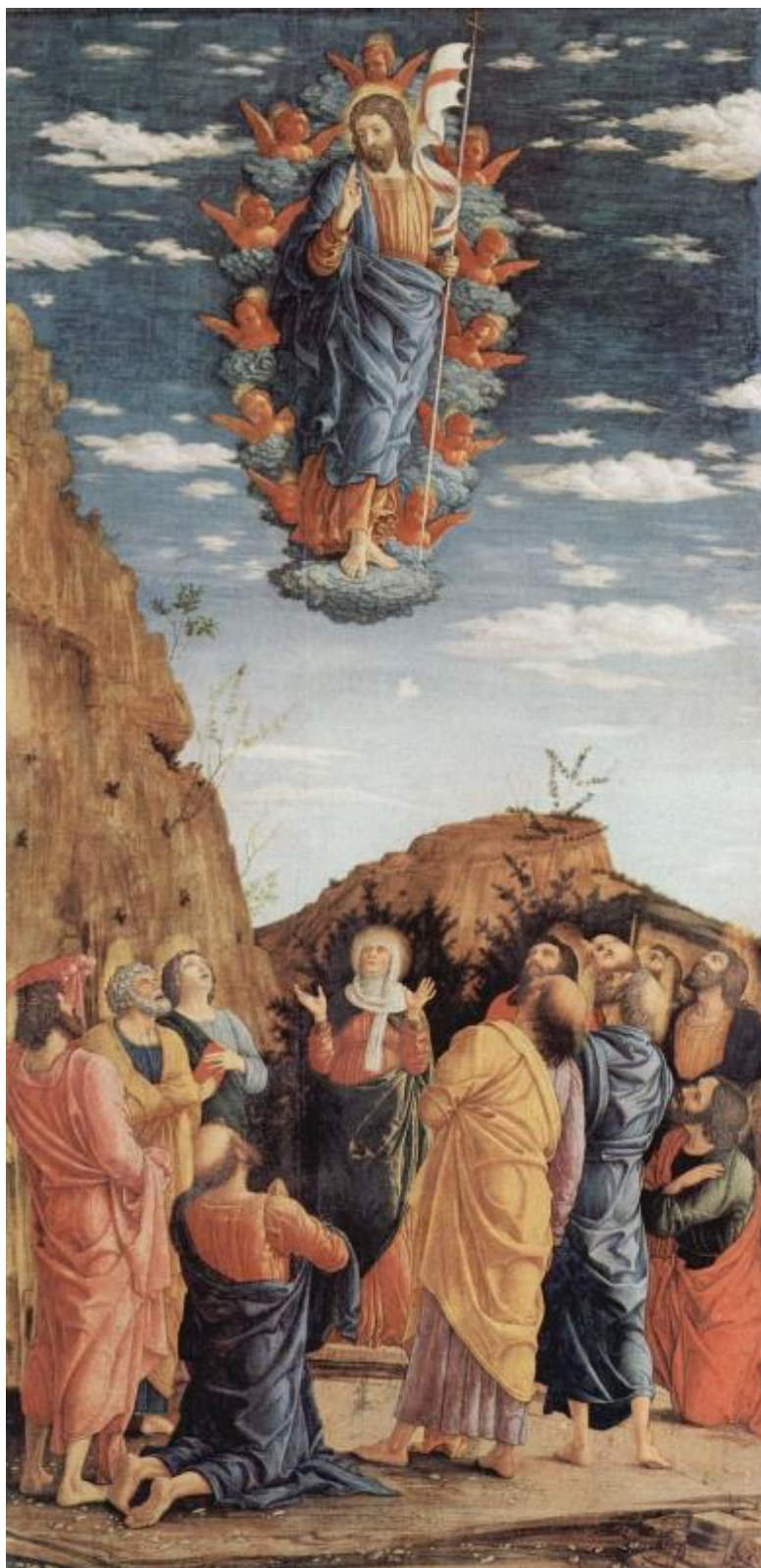
Andrea Mantegna, Triptyque des Offices, 1461, Galerie des Offices, Florence