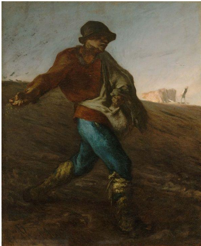
Jean-François Millet, Le Semeur, 1851, Museum of Fine Arts, Boston, USA