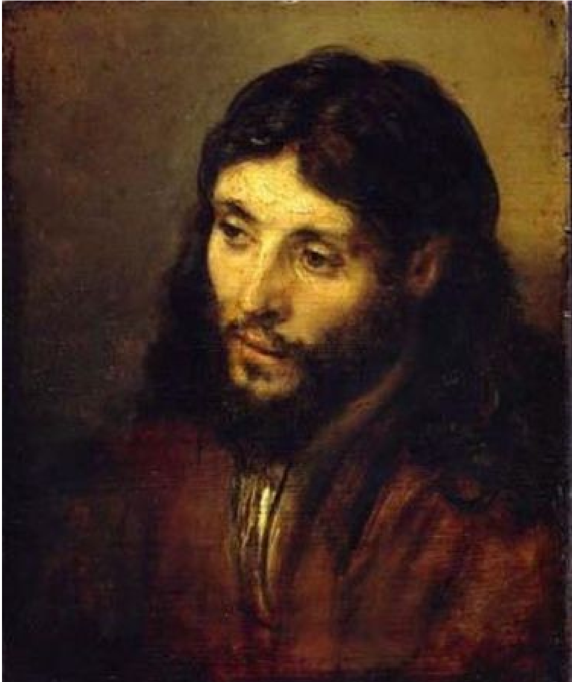
Rembrandt, tête du Christ, Gemäldegalerie de Berlin, 1648