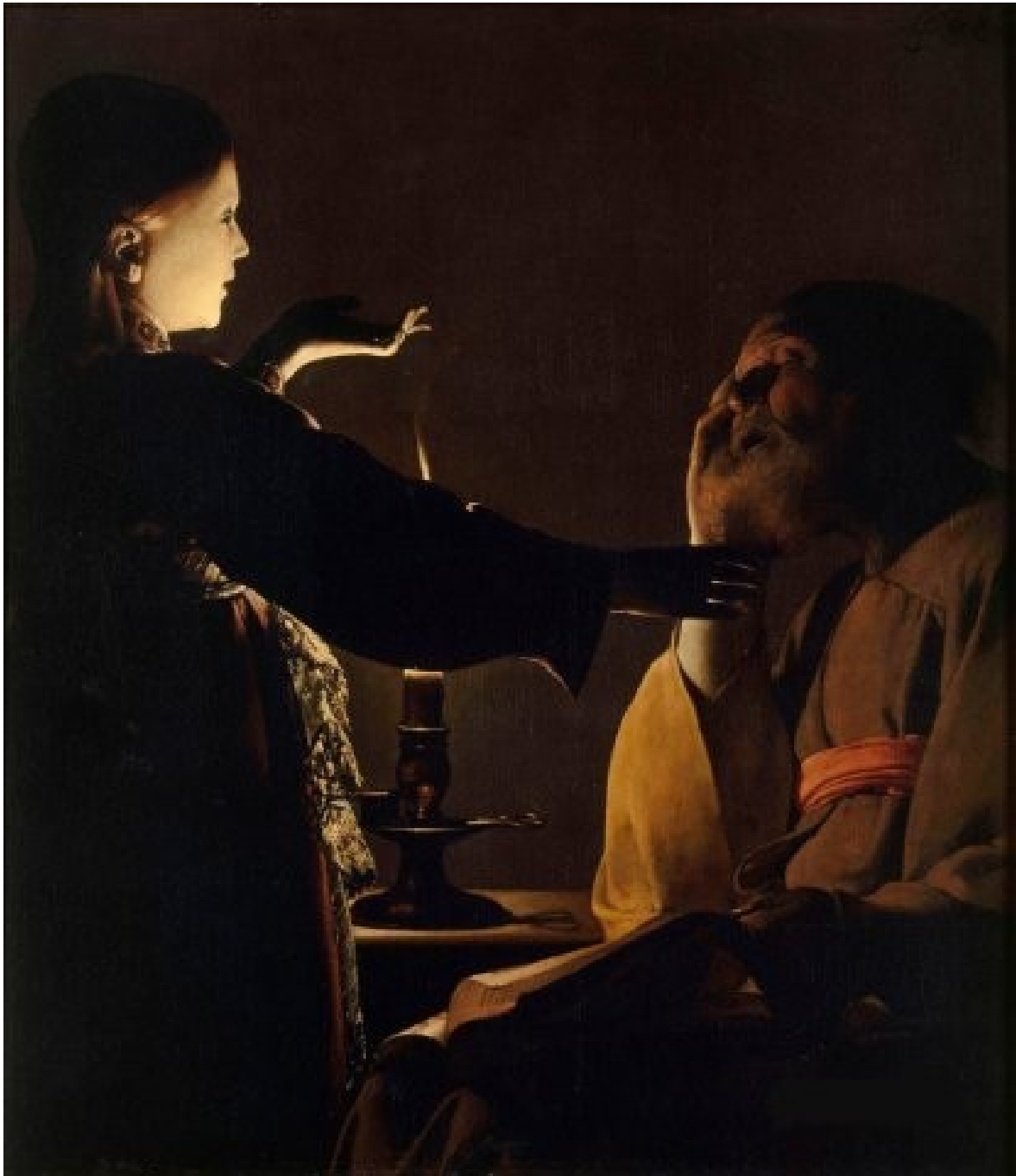
Georges de la Tour - Saint-Joseph le veilleur endormi et réveillé par un ange, 1630 - 1635