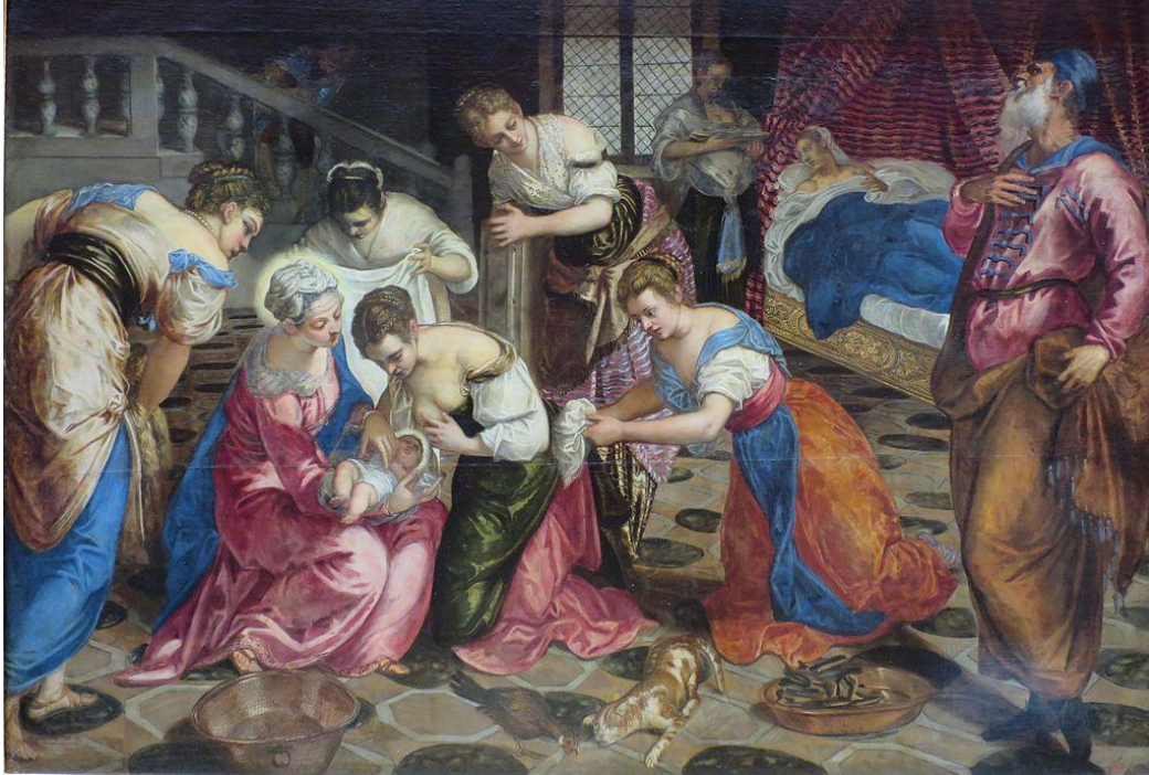
Le Tintoret, La naissance de Jean Baptiste , 1550, Musée de l'Ermitage