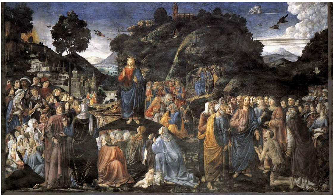
Cosimo Rosselli, Le Sermon sur la montagne , chapelle Sixtine.