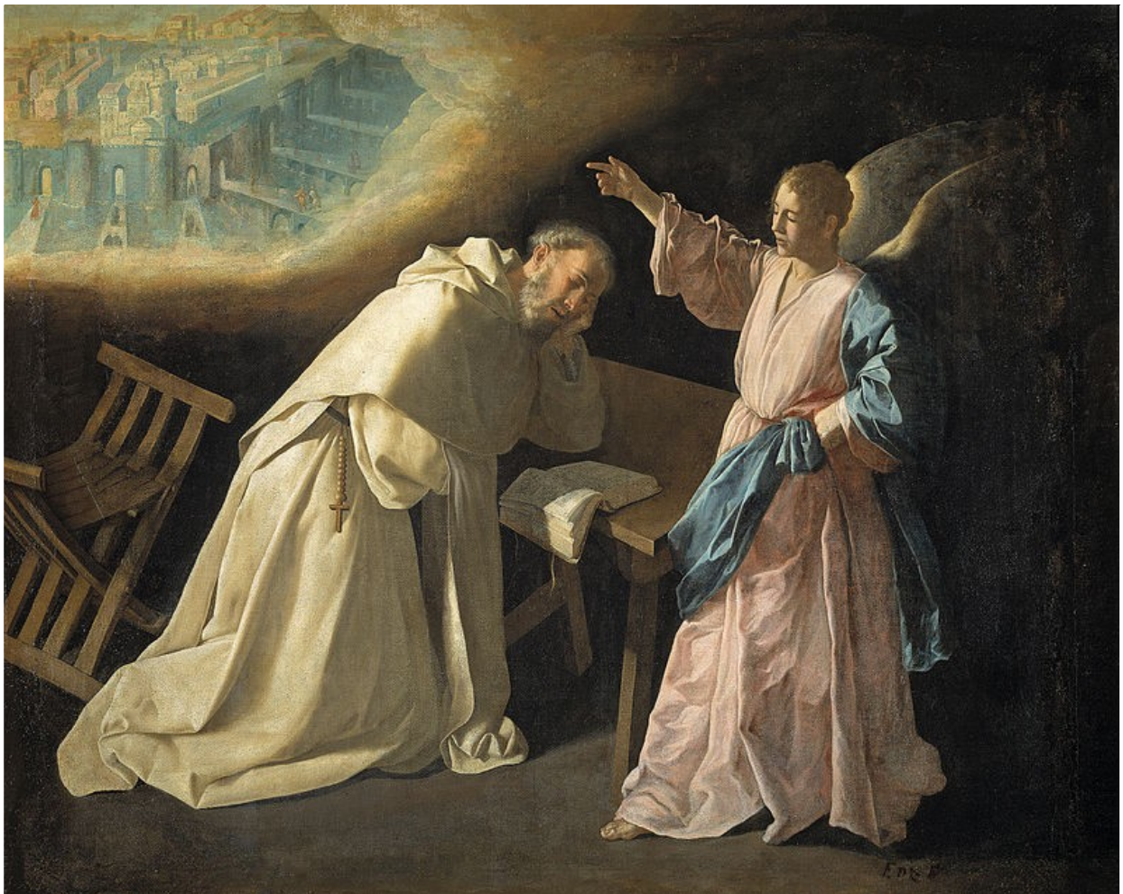
Francisco de Zurbarán, La vision de Jérusalem céleste , 1629, Musée du Prado