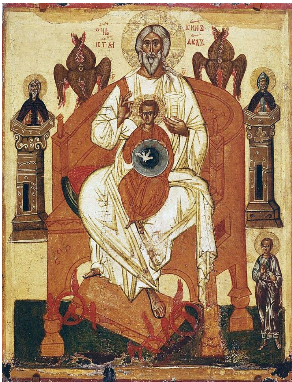
Icone de la trinité, dite La Paternité , école de Novgorod, début du XV ème siècle, Galerie Tretiakov, Moscou.