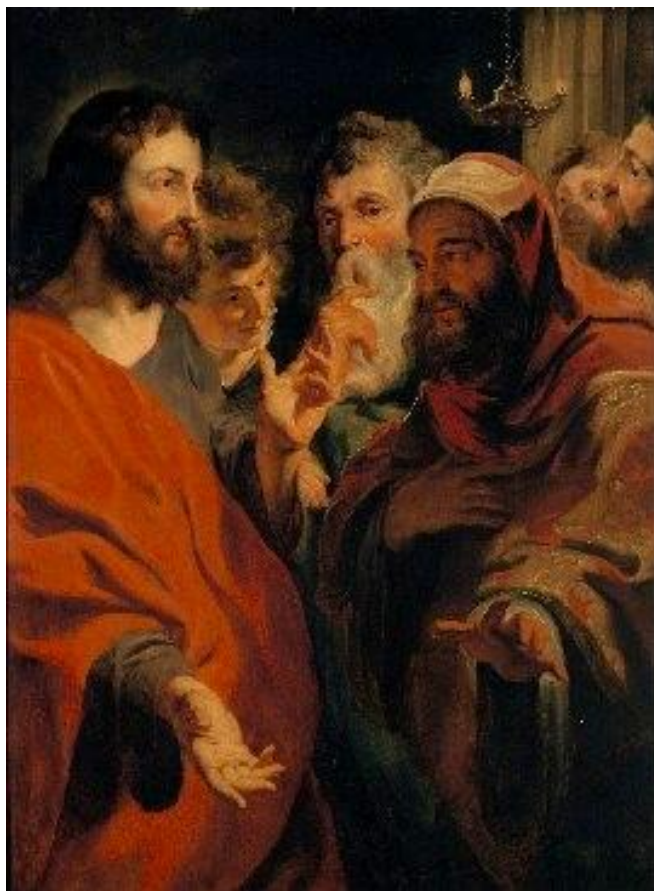
Jacques Jordaens, Jésus instruisant Nicodème , 1620, Musée des Beaux-arts, Tournai.