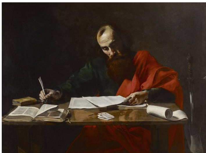
Valentin de Boulogne, Saint Paul écrivant ses épîtres , début du XVII ème siècle, Museum of Fine Arts, Houston.