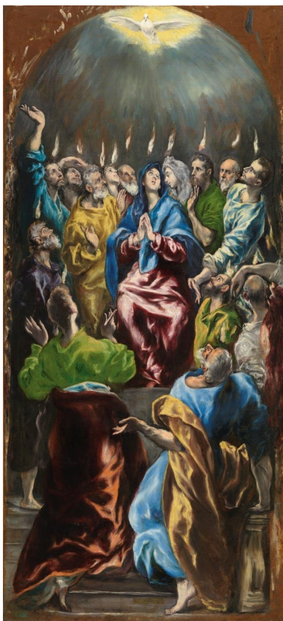
Le Greco, La Pentecôte , vers 1600, Madrid, Musée du Prado.