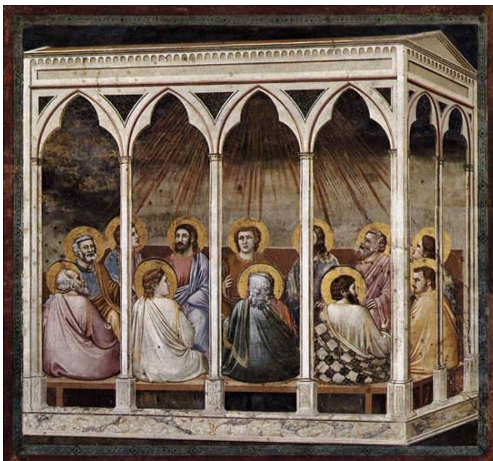
Giotto, La Pentecôte , 1303-1305, fresque, chapelle des Scrovegni, Padoue.