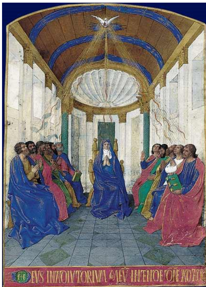
Heures d'Étienne Chevalier, enluminées par Jean Fouquet, « La Pentecôte », 1452-1460, Chantilly, Musée Condé.