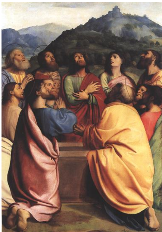
Alberto Piazza, Apôtres autour du Sépulcre , début XVIe siècle, musée d'Etat, Berlin.