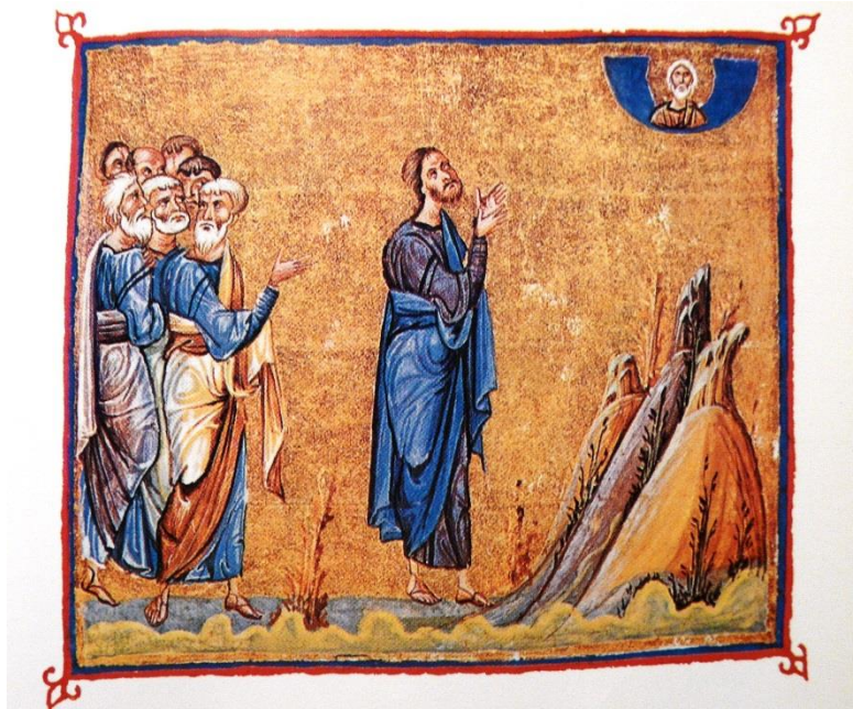
Christ en prière, Enluminure d'un manuscrit du monastère de Dionysiou, sur le Mont Athos, vers 1059.