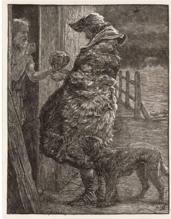
John Everest Millais, Parabole de l'ami importun , gravure, 1864, Tate Gallery Londres.

• Cantique : ALL 43-06 « Mon Dieu, mon Père », Strophes 1 à 4 (précédées d'une courte introduction), Daniel Maurer, orgue. (Cliquer sur la touche Ctrl et simultanément sur le lien en bleu ci-dessous).