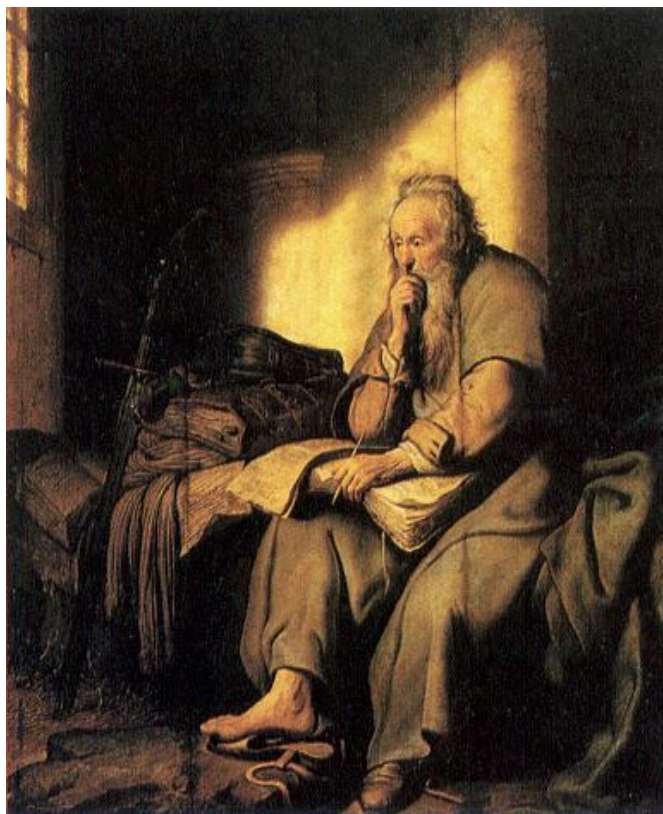
Rembrandt, Saint Paul en prison , 1627, Stuttgart, Staatsgalerie.