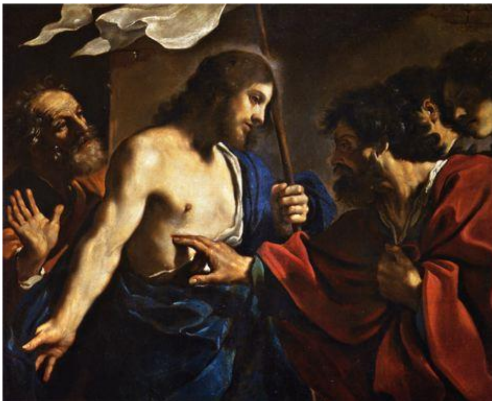
Le Guerchin, L'incrédulité de Saint-Thomas , 1621, Pinacothèque du Vatican.