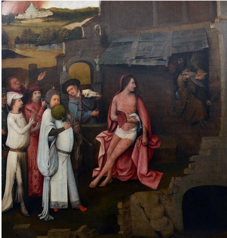
Atelier de Jérôme Bosch, « Les épreuves de Job », détail panneau central du Triptyque de Job , vers 1510-1520, Musée Groeninge, Bruges.