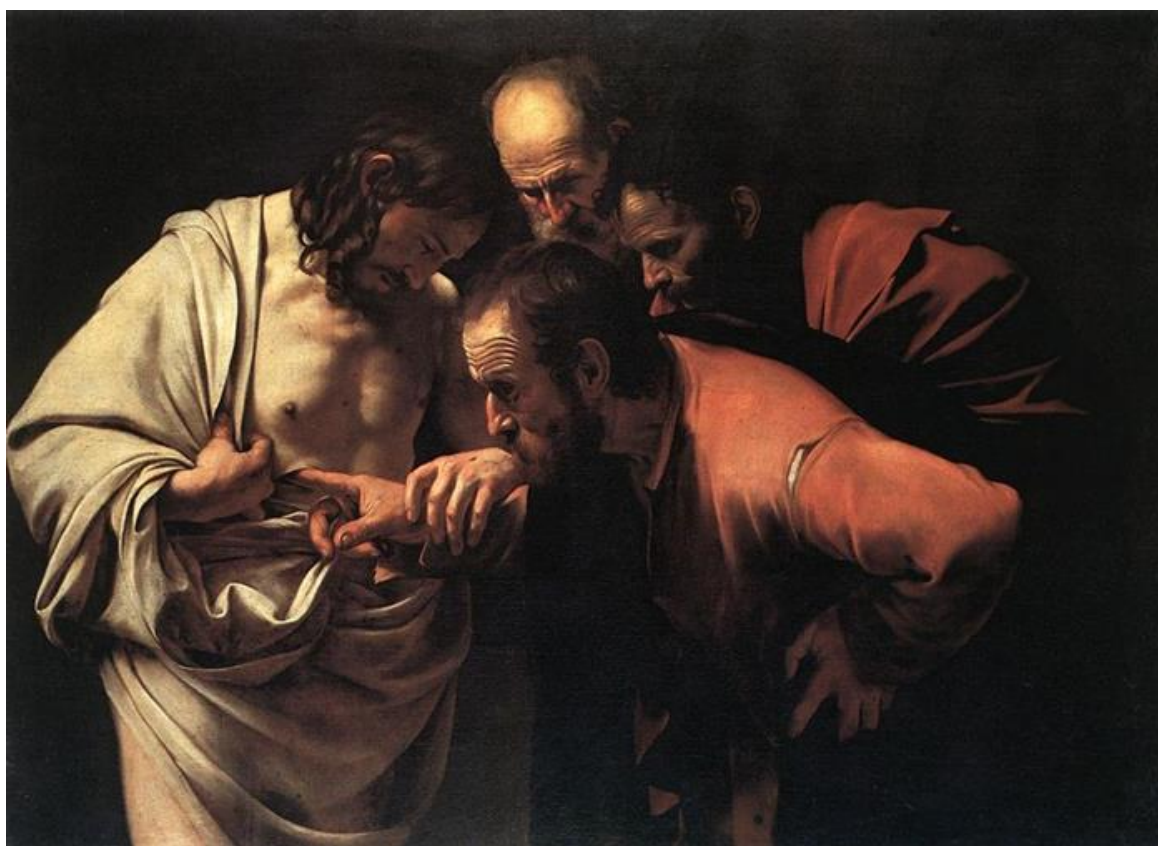
Le Caravage, L'incrédulité de Saint-Thomas , vers 1603, Palais de Sanssouci, Potsdam.