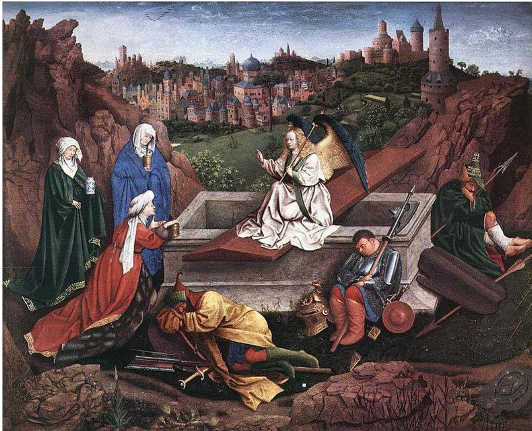
Jan van Eyck et Hubert van Eyck, Les Trois Maries au Sépulcre , entre 1425 et 1435, Musée Boijmans Van Beuningen, Rotterdam.