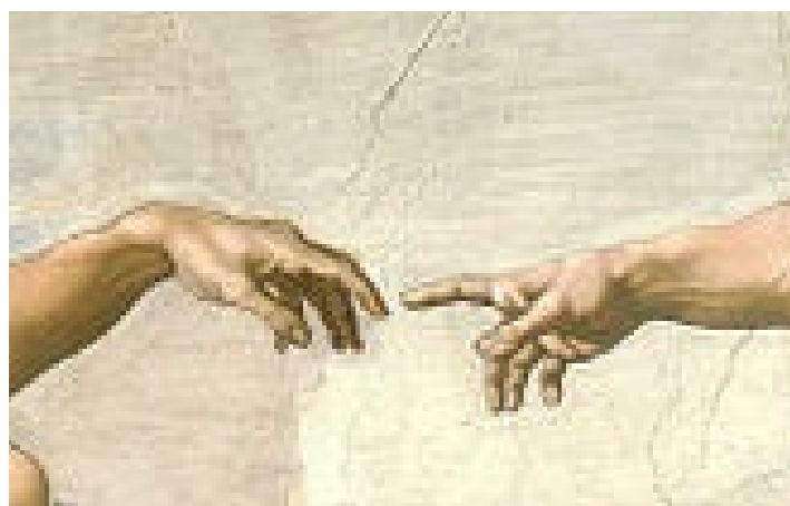
Michel-Ange, détail de la création de Adam , Chapelle sixtine, fresque, 1508-1512