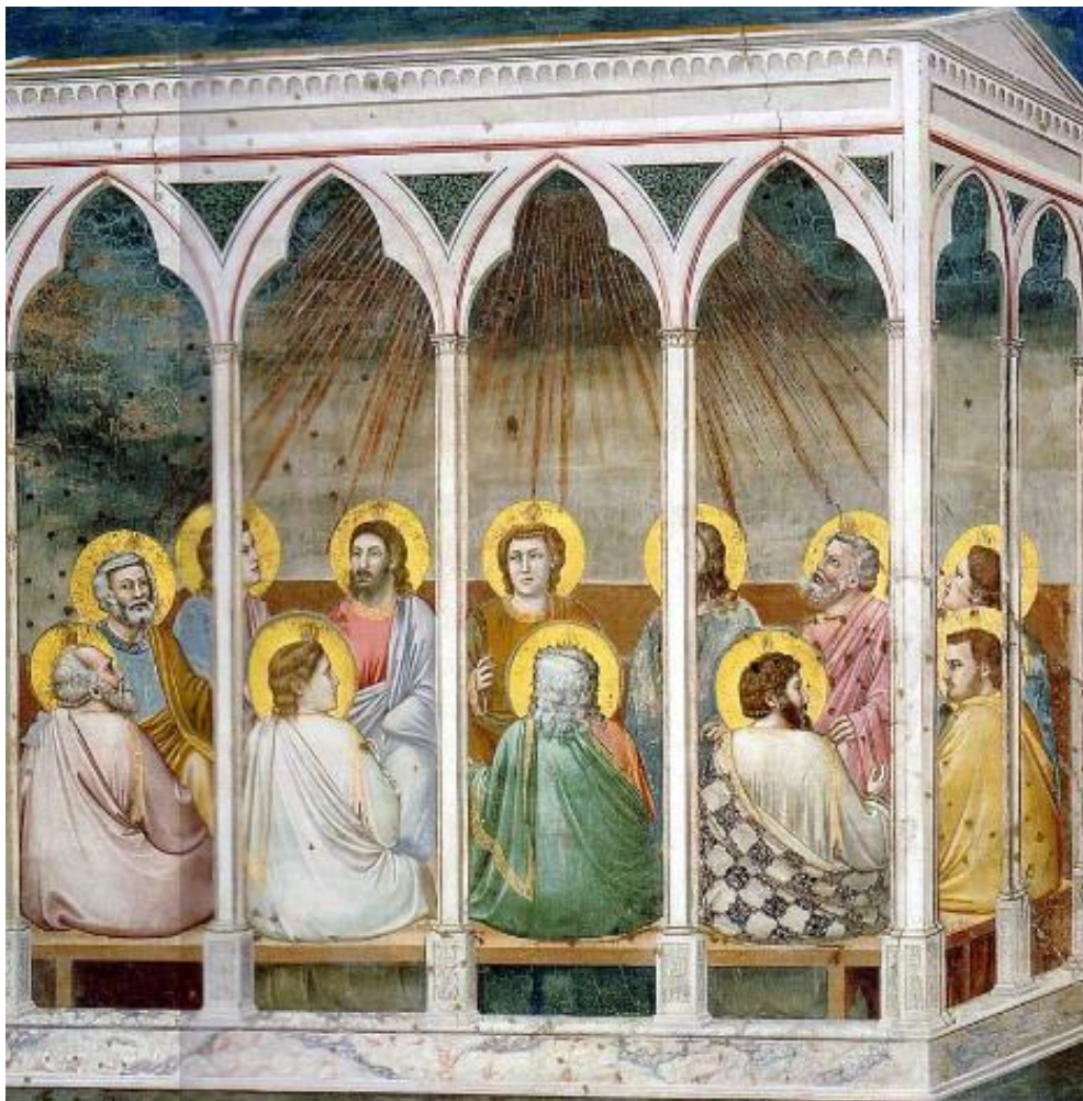
Giotto di Bondone, La Pentecôte, 1303, fresque de la chapelle Scrovegni