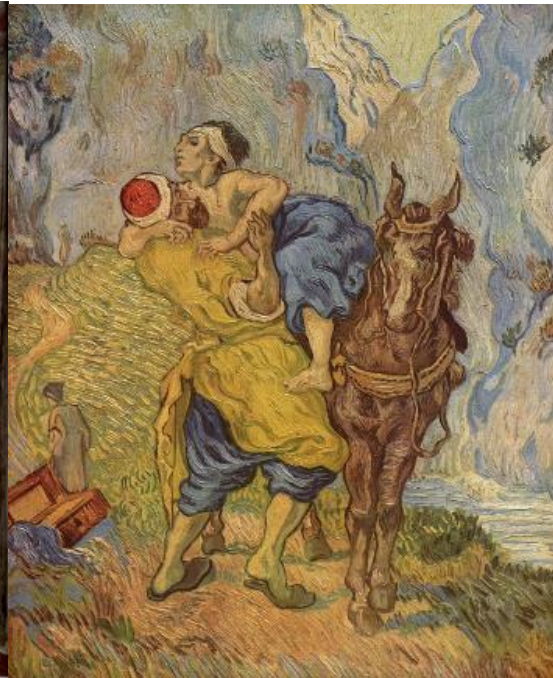
Vincent Van Gogh, Le bon samaritain , 1890, 1890, Rijksmuseum Kröller-Müller, Otterlo

ANNONCES : Veuillez prendre connaissance des annonces à la fin de la méditation biblique ci-dessous.