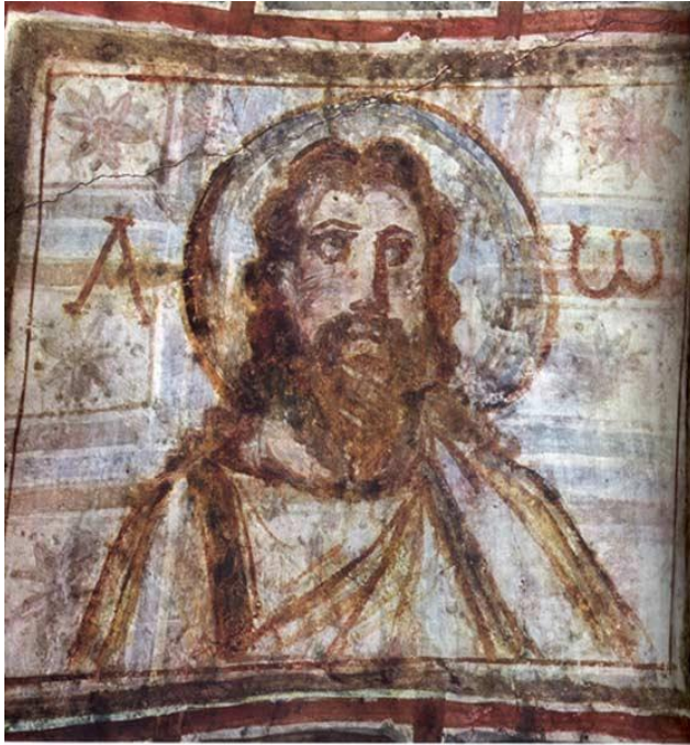
mière représentation connue du Christ avec une barbe Catacombes de Comodilla, 4ème siècle