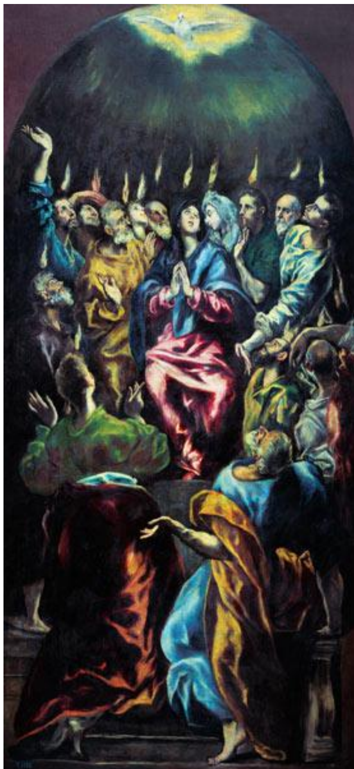
El Greco, la réception du Saint-Esprit (1605/10)